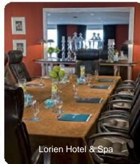
Lorien Hotel &amp; Spa

Chez Kimpton, chaque rassemblement retient notre complète attention. Que votre objectif soit la productivité ou festivité, nous vous accompagnons à chaque étape avec un service personnalisé pour vous garantir la réussite de votre événement.