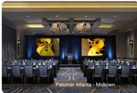
Palomar Atlanta - Midtown