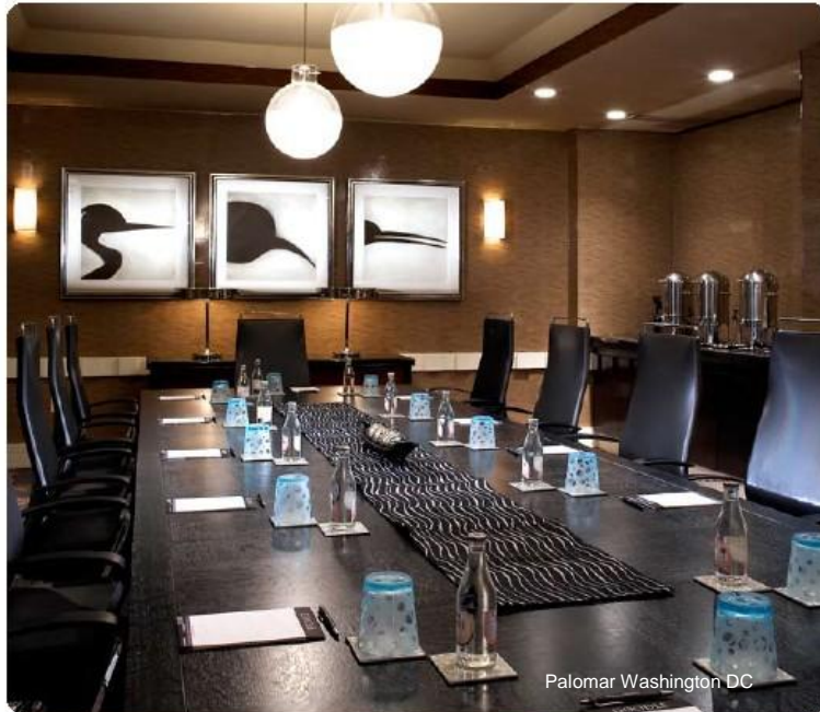
Palomar Washington DC